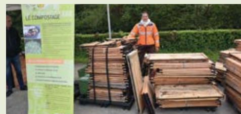
La dernière distribution a été un succès.

Pour permettre aux habitants de valoriser les déchets organiques, le SMIRTOM du Perche ornaï propose des composteurs individuels. Cette initiative rencontre un grand succès. Face à la demande, une nouvelle date de distribution a été arrêtée pour la rentrée. La remise des composteurs se déroulera le mercredi 11 septembre sur le parking du pont rouge à Longny-au-Perche. Si vous êtes intéressé, il faut réserver votre composteur auprès du SMIRTOM. Les modèles proposés sont en bois (douglas non traité). Deux tailles sont disponibles : 300 litres et 600 litres, en fonction du nombre de personnes composant le foyer et la superficie du terrain. La moitié du coût de l'acquisition est pris en charge par le SMIRTOM du Perche ornaï. Le reste à charge pour le particulier est de 36 euros (300 litres) et de 44 € pour (600 litres). Comment réserver un composteur ?