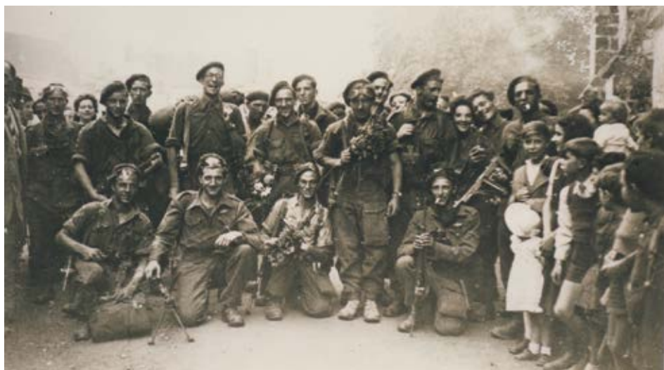
Les parachutistes belges libérateurs de Longny-au-Perche accueillis par la population.

Le 13 août aura lieu le drame de Tourouvre perpétué également par la sinistre 12 SS Hitlerjugend.