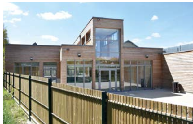
Grâce à l'apport et les économies de la chaufferie bois, la piscine Jean-Marc de Chastenet a pu accueillir le public tout au long de l'été dernier.

en train de travailler en partenariat avec le service de développement économique de la CdC des Hauts du Perche pour améliorer et conforter notre tissu commercial local. Malgré de nouvelles ouvertures récentes comme l'armurerie ou l'extension du café du commerce, il reste beaucoup à faire pour renforcer l'attractivité de Longny-au-Perche, Petite cité de caractère. La municipalité suit également de près le développement de la ZA les Réhardières où plu-