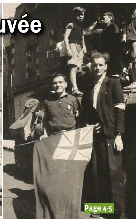
Le 80 e anniversaire de la libération de la ville est l'occasion de revenir sur cette journée historique. Découvrez le récit des événements tels qu'ils se sont déroulés.