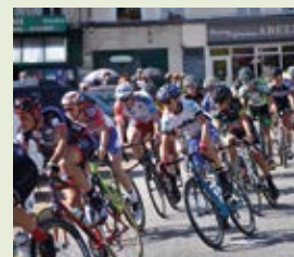
Longny célébrera les coureurs cyclistes le 7 sept.

Pour la première fois, le comité de l'Orne cycliste qui organise le Tour de l'Orne cycliste a choisi de partir de Longny-au-Perche, le samedi 7 septembre. Pour cette 8 ème édition, la 1 ère étape conduira les