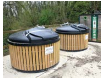
Les deux containers semi enterrés présents sur la commune.

Au cours du mois de décembre 2023, le SMIRTOM du Perche ornais a installé à Malétable sur un terrain communal (à l'endroit de l'ancienne carrière), deux containers semi-enterrés destinés aux ordures ménagères. L'objectif du SMIRTOM du Perche ornais est de regrouper en un endroit bien identifié les nouveaux containers avec une zone de stationnement. C'est l'entreprise Dassé de Neuilly-sur-Eure qui s'est chargée de poser les containers.