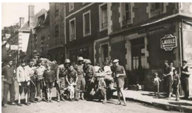
Soldats et Longnyciens dans le bas de la rue du Général-de-Gaulle.

lement là comme chaque année ainsi que des membres des familles des fusillés et du Général Jérôme Levesque.