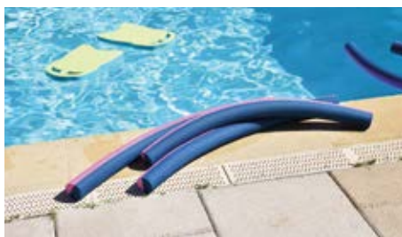
L'aquagym une activité souhaitée par la population.

La piscine couverte Jean-Marc de Chastenet a rouvert ses portes au 1er mai. Elle entame sa seconde saison estivale avec une nouveauté. À la demande de la Maison des Jeunes et de la culture (MJC), la commune de Longny-les-Villages vient d'étoffer son offre en proposant des séances d'aquagym. Le conseil municipal a validé ce choix et signé avec la MJC une convention de mise à disposition gratuite de la piscine et du maître-nageur. Deux créneaux ont été retenus : le mardi de 17h à 18h et le samedi de 11h à 12h. Cette activité complémentaire à