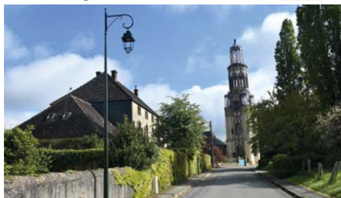
Les travaux d'enfouissement des réseaux s'achèvent.