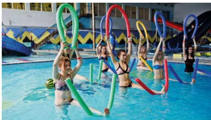
Deux créneaux sont ouverts chaque semaine.