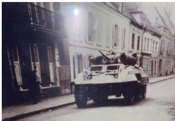
Les blindés entrent dans Longny.

Dans les jours qui suivent, différents accrochages sérieux auront lieu notamment dans les bois sur la route de Marchainville détruisant des véhicules blindés allemands et tuant des soldats ennemis. Ils iront ensemble (le groupe Levesque et les hommes de Kirschen) au château de Miserai affronter les forces d'occupation. Deux allemands sont tués et ils mettent la main sur