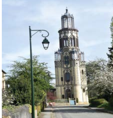
L'effacement des réseaux met en valeur Notre-Dame de la Salette.

Avec les beaux jours qui reviennent, le bourg de Malétable offre au visiteur de passage son nouveau visage. L'effacement des réseaux réalisé par le Territoire d'énergie de l'Orne (Te61) redonne un véritable cachet au lieu et notamment à Notre Dame de la Salette, véritable curiosité touristique