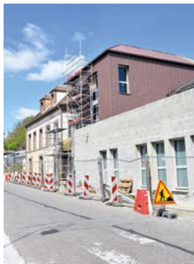
Le cabinet médical communal en cours de construction a été la priorité de l'année 2023.

« Suite au COVID et pour faire face aux travaux qui étaient nécessaires, la municipalité a dès 2022 décidé de mettre en place un plan de travaux divers sur les huit communes déléguées à hauteur de 900 000 € répartis sur deux exercices budgétaires. En agissant ainsi, nous avons pu passer le cap et réaliser tout ce que nous souhaitions faire. Nous avons également privilégié le recours à nos artisans locaux durant cette période qui était difficile pour tout le monde. C'était important de les soutenir en les faisant travailler. A la fin 2023, tout ce que nous avions prévu était réalisé. »