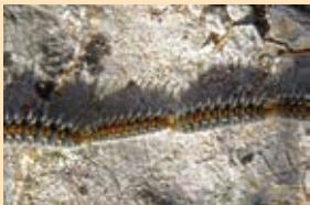
Des chenilles urticantes à ne pas toucher ni approcher.

Depuis le mois de mars 2018, un arrêté municipal pris par la commune de Longny-les-Villages prévient de la dangerosité de la chenille processionnaire. La lutte contre ces organismes nuisibles est OBLIGATOIRE de façon permanente dès leur apparition et ce quel que soit le stade de leur développement et quels que soient les végétaux sur lesquels ils sont détectés. Les propriétaires ou locataires de parcelles où sont implantés des arbres (pins, sapins, cèdres, cyprès, chênes...) sont tenus de supprimer soit par produits appropriés homologués, soit mécaniquement ou par piégeage avec incinération ou tout autre moyen adapté, les cocons élaborés par les chenilles processionnaires. A cette occasion, toutes les précautions nécessaires devront être prises (lunettes, masque, pantalon...)