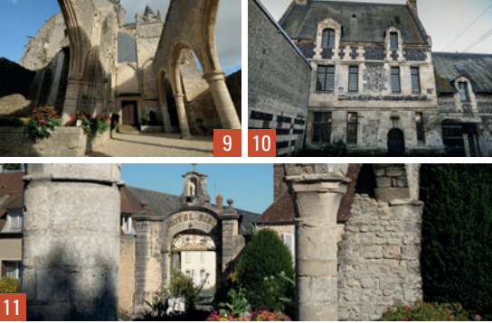
9. Ecouché / 10. Touques / 11. Sées

Découvrez-les sur www.petitescitesdecaractere.com