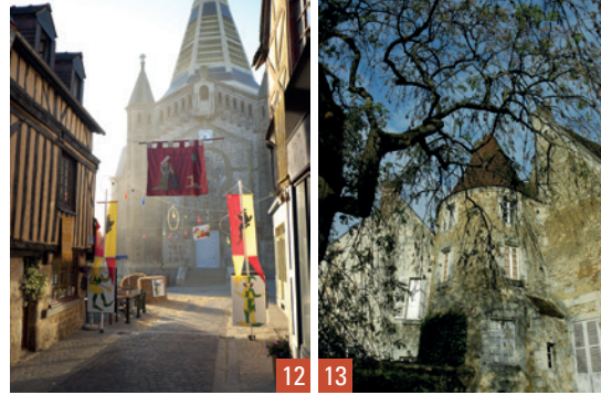
12. Domfront / 13. Mortagne-au-Perche

📍 15h, sur réservation 👉 Mairie - 02 33 30 60 72